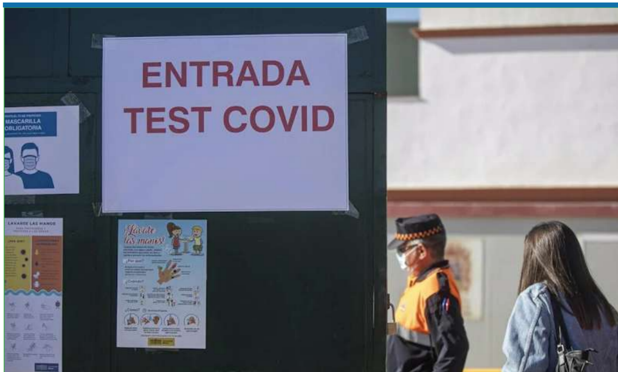
Cartel en Almería para realizarse el test Covid en las últimas semanas.