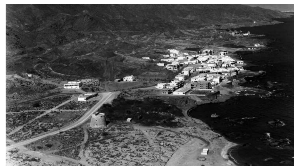
Vista aérea de Villaricos hacia 1977 con el castillo en primer término. Delante de este edificio se levantó el efímero faro.

talúrgicos para su funcionamiento, y otras manufacturas, así como al embarque de las producciones metalíferas que se destinaban a la exportación. A esta densidad de tráfico marítimo había que garantizarle unas condiciones de seguridad básicas a lo largo de aquel litoral irregular, a veces accidentado y con un fondo rocoso que ponía en riesgo a los grandes cargueros en sus aproximaciones. Se hacía preciso, en definitiva, la construcción de un faro que, situado en la margen izquierda del pequeño delta que formaba el Almanzora en su desembocadura, avisase con sus destellos de la cercanía al concurrido fondeadero en que se había convertido el golfo entre Garrucha y el Pozo del Esparto. Así lo consideraron las autoridades marítimas y, tras una inversión de casi 70.000 reales y dos años de construcción, su encendido inaugural aconteció el 30 de abril de 1863.