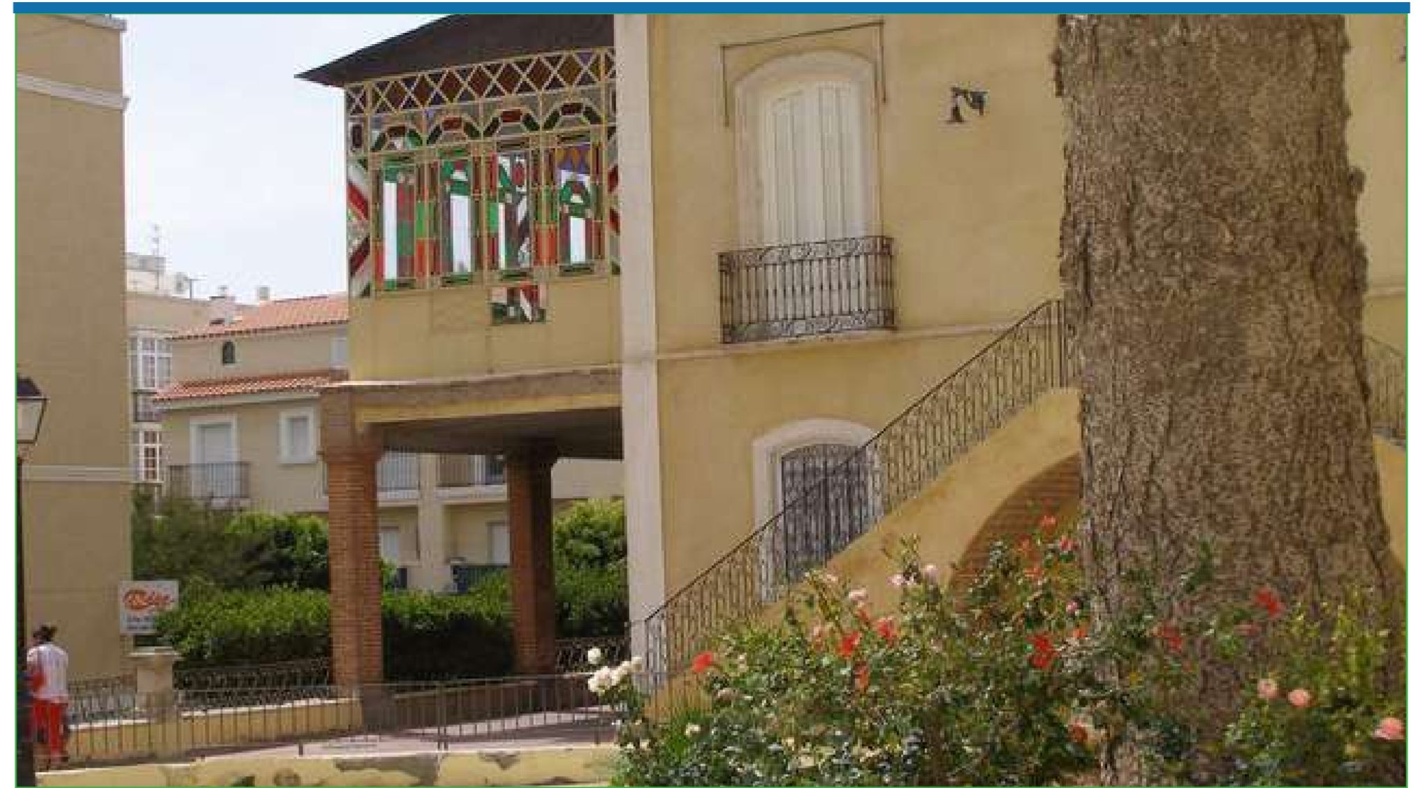
Villa Anita o Casa de García Alix, palacete del siglo XIX en plena Avenida Barcelona de Cuevas del Almanzora.

Vamos a seguir trabajando para que Cuevas del Almanzora sea un pueblo mejor, que progrese y que no deje a nadie atrás. Iniciamos el nuevo año con todas las esperanzas y fuerzas para conseguir que, pese a todas las dificultades que nos encontramos en todos los sentidos, sigamos creciendo y construyendo ese pueblo mejor que tod@s queremos. Feliz Año Nuevo.